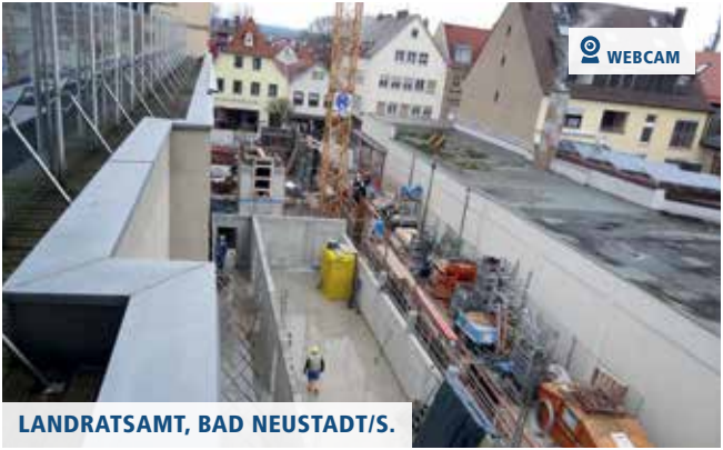
LANDRATSAMT, BAD NEUSTADT/S.

▲ Juli: Die neue Brücke am Heimathof wurde im Sommer 2015 fertiggestellt.