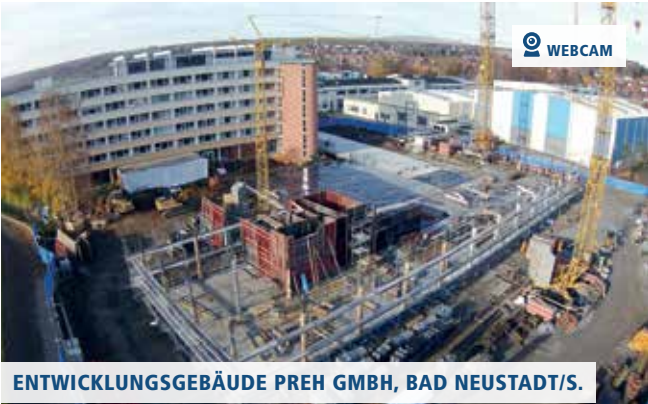
ENTWICKLUNGSGEBÄUDE PREH GMBH, BAD NEUSTADT/S.

▲ August: Die Fertigstellung der unterkellerten Erweiterung soll bis Anfang 2017 erfolgen.