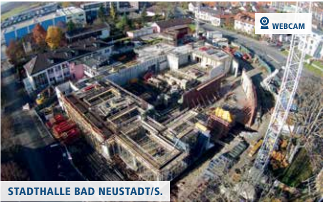
STADTHALLE BAD NEUSTADT/S.

▲ April: Die im Jahre 1819 erbaute Kirche wird derzeit komplett saniert.