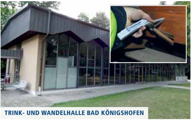
TRINK- UND WANDELHALLE BAD KÖNIGSHOFEN

▲ Januar: Umbau und Sanierung ehemalige Kurparkklinik