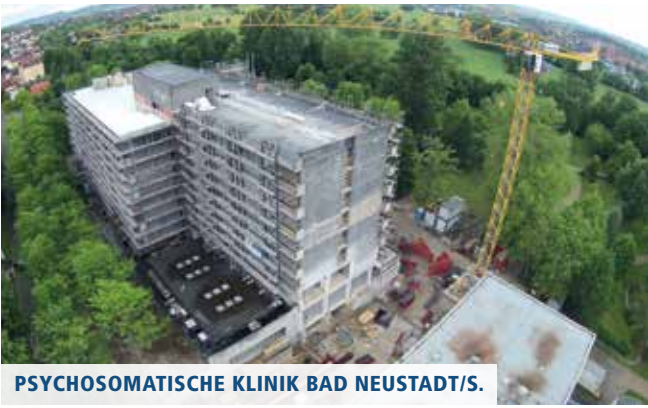
PSYCHOSOMATISCHE KLINIK BAD NEUSTADT/S.

▲ Januar: Umbau und Sanierung ehemalige Kurparkklinik