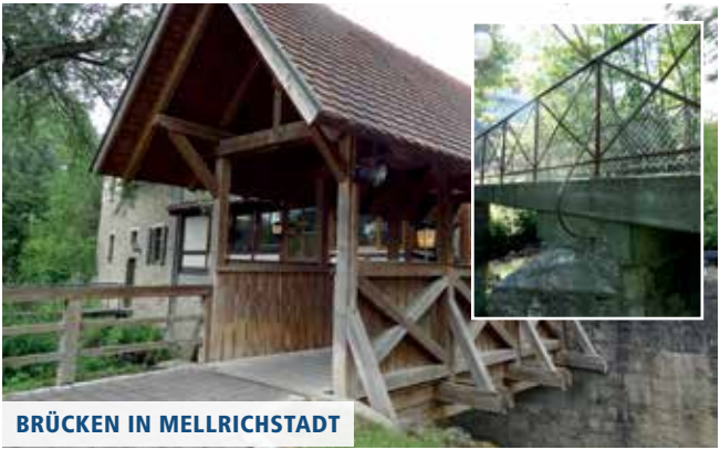
BRÜCKEN IN MELLRICHSTADT

▲ Mai: Der zukunftsweisende Neubau soll bis Ende 2016 fertiggestellt werden.